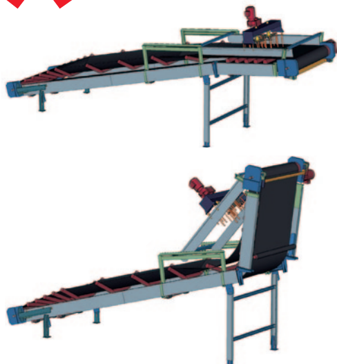
Ribaltabile senza smontare la spirale.